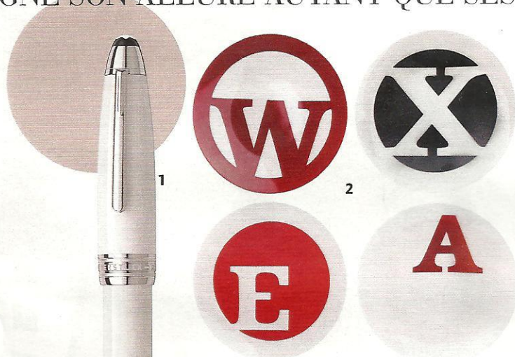
1. Stylo plume Meisterstück, Montblanc, 1950 €. 2. Assiettes Typo, design David Petraz, Made in Design, 28€ l'une (dont 1€ est reversé à l'ONG Friends International pour l'alphabétisation au Cambodge). 3. Gommés Sonia Rykiel, 10 € pièce.