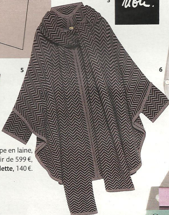
4. Sac monogrammé, Fendi, 705 €. 5. Cape en laine, Sandro, 345 €. 6. iPad, Apple, à partir de 599 €, et support iPad par Marc Delmatto, Colette, 140 €.