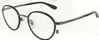
7. Parfum Baudelaire, 100ml, Colette, 140 €. 8. Lunettes de vues Paul & Joe Lunettes, 200 €. 9. Étagères Ceci n'est pas un Livre, en bois, Design de Collection, 39€ l'une.